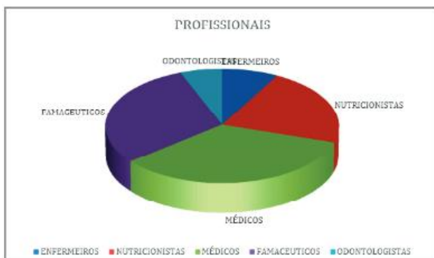
Figura 3: Profissionais que utilizam fitoterapia (Marques., et al 2019)

É notório que o farmacêutico é o profissional que tem competência para prescrever e orientar sobre os medicamentos, visto que, o mesmo tem habilidades clínicas e científicas que concretizam essa capacidade. Portanto, a prescrição fitoterápica requer conhecimento científico, pois, esses medicamentos podem causar interações, reações e outros problemas caso o uso seja irracional. Muitos profissionais são habilitados para efetuar o tratamento com fitoterápicos, porém, por conta do pouco conhecimento dos mesmos essa prescrição muitas vezes passa-se despercebida. Contudo o farmacêutico é um dos profissionais que acreditam no tratamento com fitoterápico, na figura 3 é exposto os profissionais que usam a fitoterapia como tratamento (MARQUES, et al 2019).